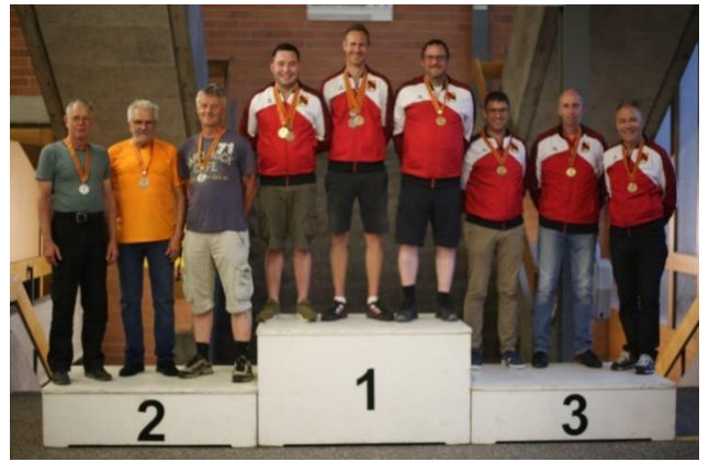
Gruppe Sport liegend