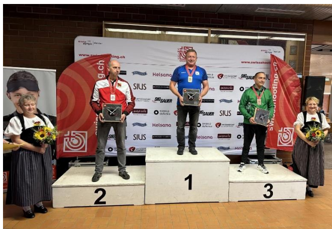
Siegerehrung Sportgewehr liegend Senioren