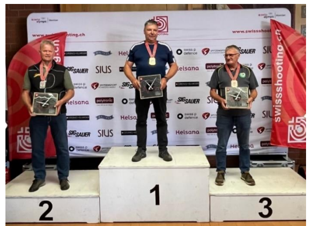
Siegerehrung Sturmgewehr 90 liegend