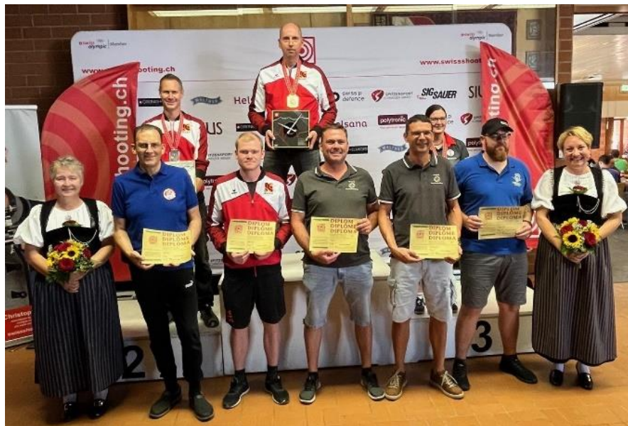
Siegerehrung 2-Stellungsmatch Karabiner