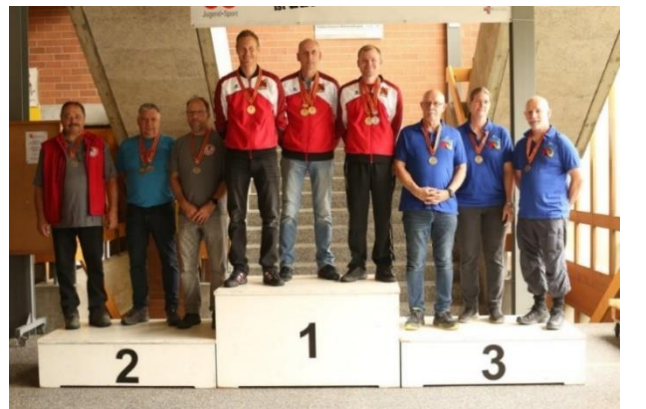
Gruppe Ordonnanz 2-Stellung