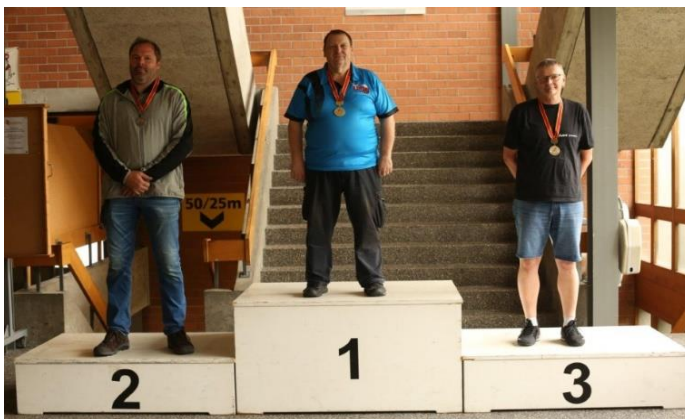
Stgw 5702 / Stgw 90 liegend