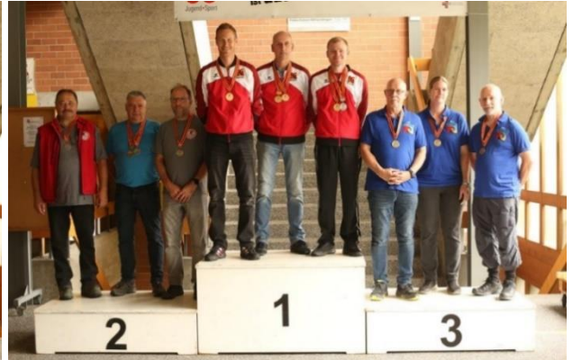
Gruppe Standardgewehr 2-Stellung