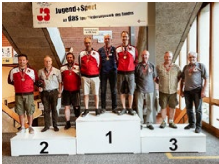
2. Mittelland 3