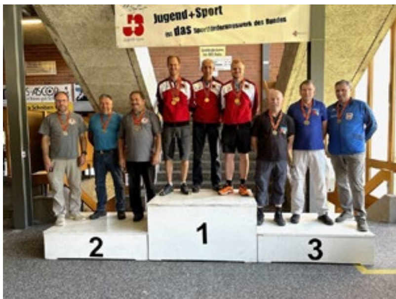
KM G300 Ordonnanz 2-Stellung Team 2. Oberland 1 1. Mittelland 1 3. Oberaargau 1