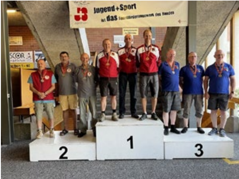
KM G300 Standard 2-Stellung Team 2. Oberland 1 1. Mittelland 1 3. Oberargau 1