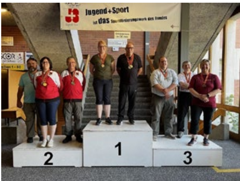
KM P50 B-Match Elite Team 2. Mittelland 1. Oberaargau 3. Oberland 2