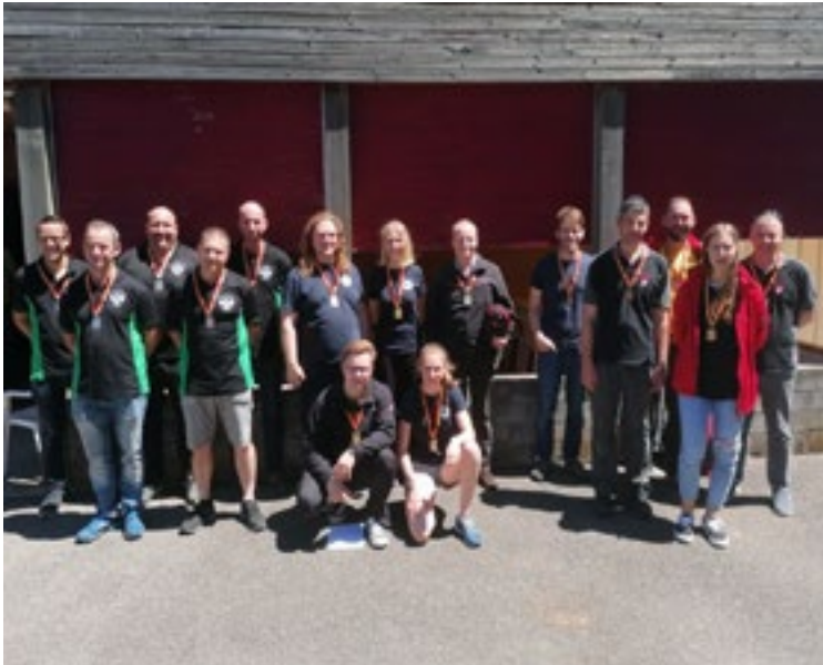
2. Rang Oberbalm

In zwei Qualifikationsdurchgängen zu je 1 Stunden 30 Minuten hatten die fünf Schützen das 20-schüssige Programm zu absolvieren. Die sechs besten Gruppen schossen danach einen Final mit je 10 Schüssen.