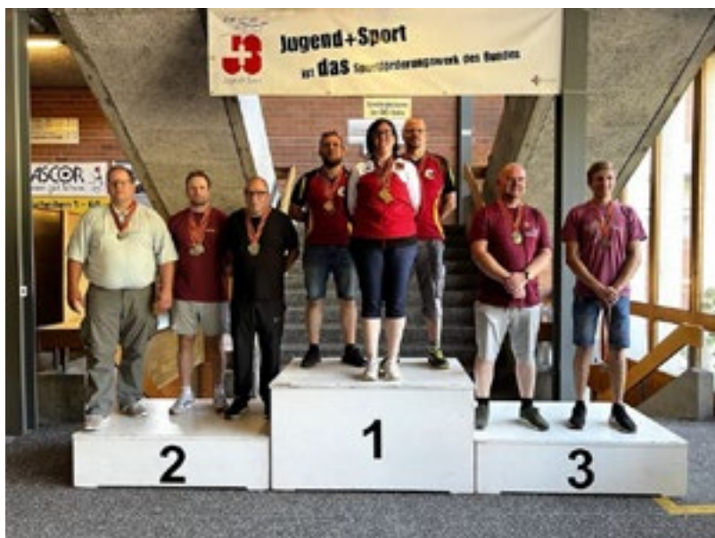
KM P25 C-Match Team 2. Oberaargau 1. Mittelland 3. Emmental